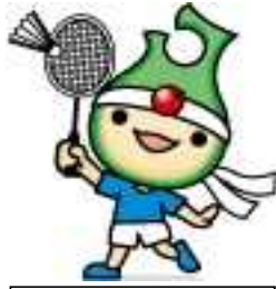
青森県高体連バドミントン専門部